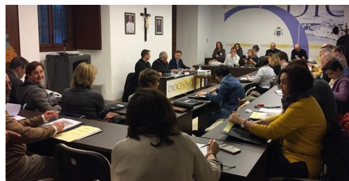
Imagen de los socios durante las Jornadas de 2018 en Córdoba

http://www.fesabid.org/federacion/asociaciones