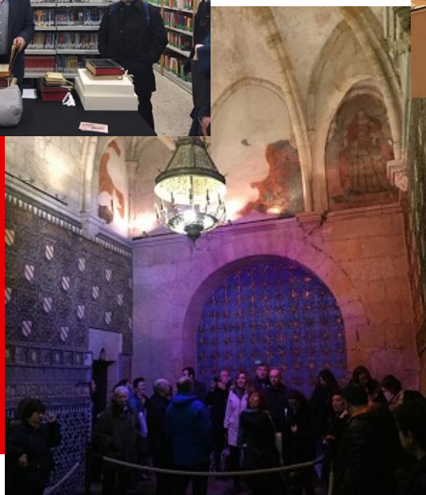
Imágenes de algunas de las visitas durante las Jornadas de 2018 en Córdoba organizadas por la Biblioteca Diocesana