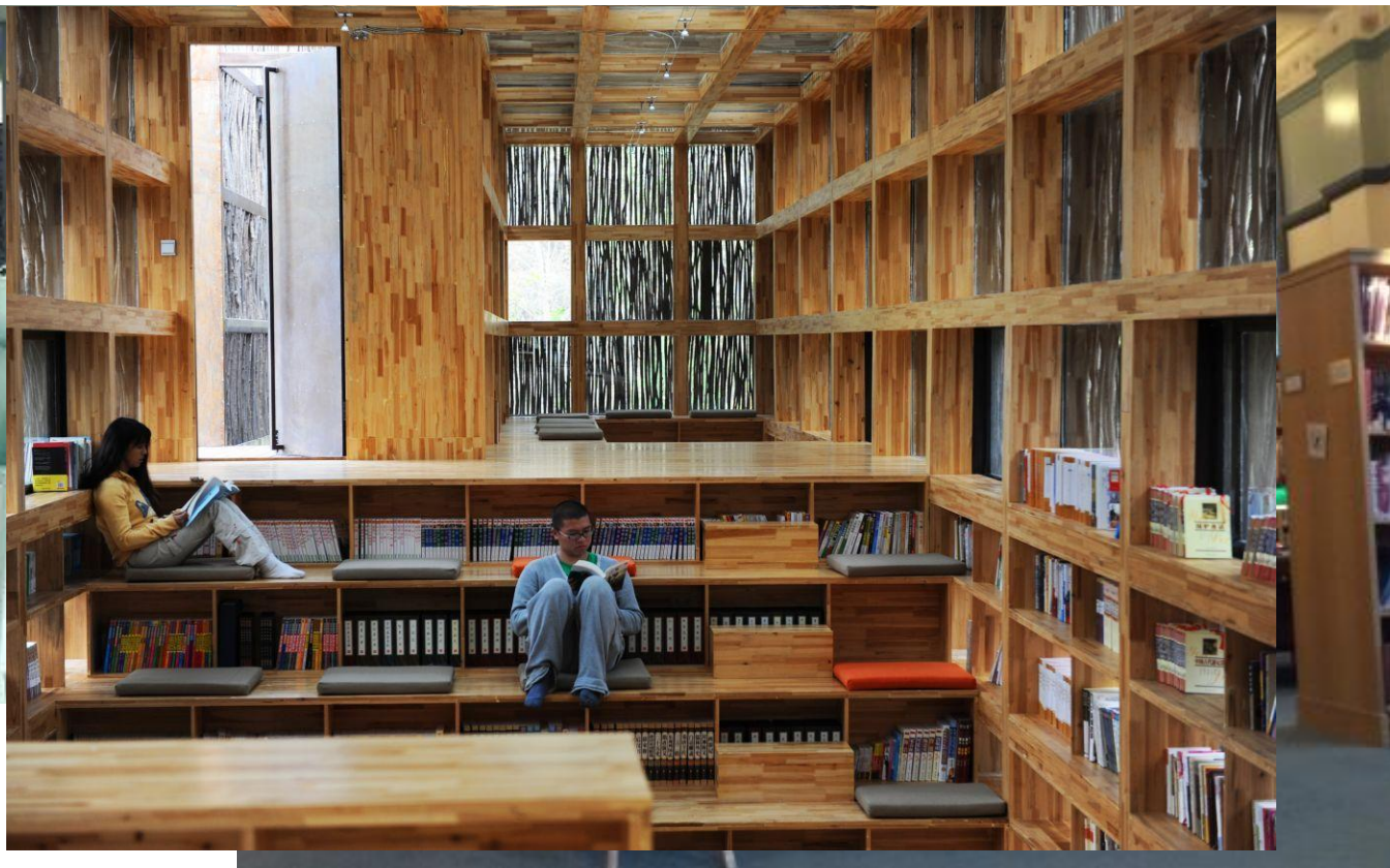
Biblioteca Central de Amsterdam Biblioteca de Liyuan, China